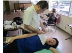
6月16日 ※前回も肩やったねえ！！ ハイそうです、お願いします。