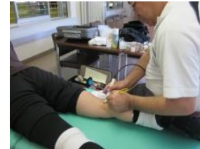
※ここはけっこう前から痛かったら う～？ 以前痛めた後、試合すると痛くな りますねえ ※病院で診てもらったとう～