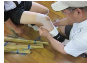
又少し出てきたなあ～