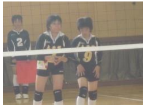
6月9日 綾乃、気合い充分です。