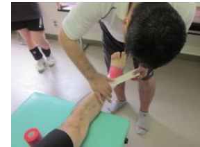
これは応急処置やけん後で病院 に行ってくださいね、たぶん二分 靭帯の損傷でしょう。