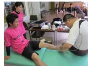
6月16日 ※これは今痛めたねえ いいえ昨日の夜の練習中にです ※貴方どっから来たと 謙早です