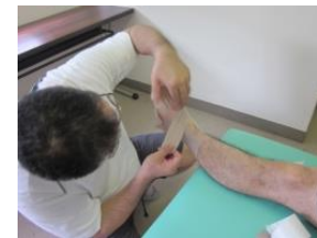
6月16日 ソフトバレーボール大会 テーピング及びサイバー治療 等、約20人程行なう。