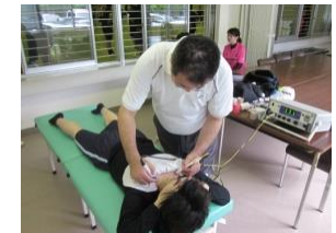
6月16日 長崎杯(三和中央体育館) ソフトバレーボール大会のトレー ナー活動中