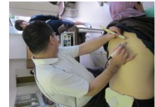
※このへんが痛いですか？ はいそこそこです！！