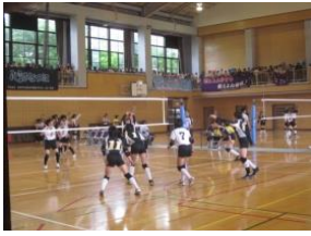
黒崎中戦 6月9日 綾乃の強烈なスパイクがきまります。