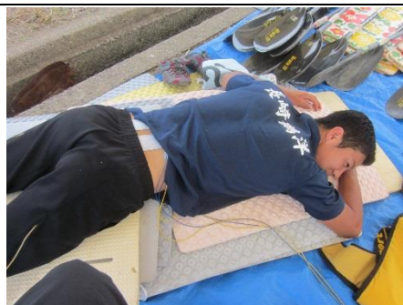
海斗今日は余裕でC-1、C-2も優勝やね