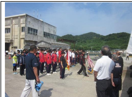
西川先生の司会で開会式