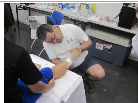
少し硬めに巻くよ、スパイラルテープ、キ ネシオテープ上からホワイトテープ三段重 ねのテーピングです