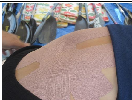
海斗にバッチリのテーピングです