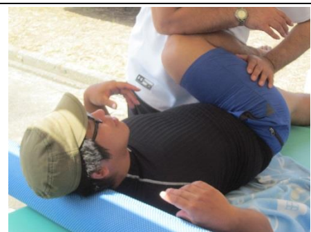
野口先生も一般で出場しますワイルドワ ーターでね!!走らんやろか?