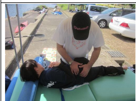
愛美 今日は西陵に負けんなよ