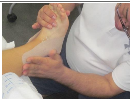
今日400m走るの 良いタイムは望めません