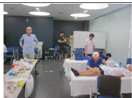
県立諫早総合グラウンド内県鍼灸師会主催 陸上競技ケアサポート 会長「今日は皆さん頑張たねありがとう ございます」