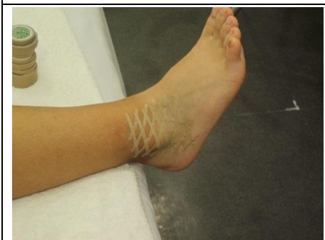
エー一週間前に車にぶつけられた時に痛 めちゃった、まだ腫れてるね 病院では骨には異常ないと言われたスパ イラルテープで腫れを引かせるね